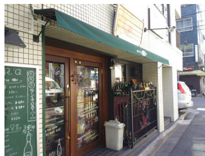
エントランス・室内など